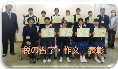
税の習字・作文 表彰