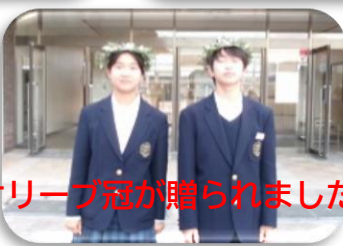
オリーブ冠が贈られました