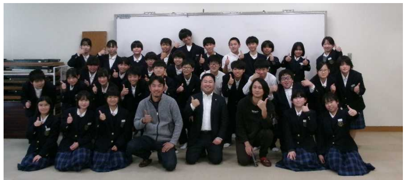
インタビュー体験での集合写真

2月は、三年生を送る会や、学年末試験など行事が盛りだくさんです。日々の手洗いうがい、規則正しい生活リズムに気をつけて体調を崩さないように注意しましょう。