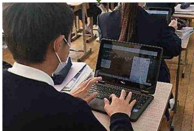
大柿高校授業体験

2年生は色々な場面で表彰されていますね。自分の努力してきたこと、頑張ってきたことが結果につながると嬉しいものです。日々の努力は必ずあなたの力になってくれています。これからもコツコツと頑張っていきましょう。