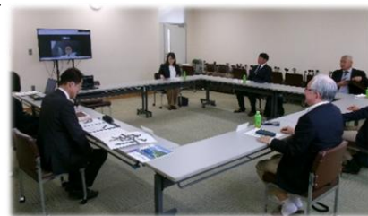
第1回運営協議会の様子

早速、4月15日（水）には、第1回の学校運営協議会を実施しました。詳細は今後「CSだより」を発刊してまいりますので、ご一読ください。