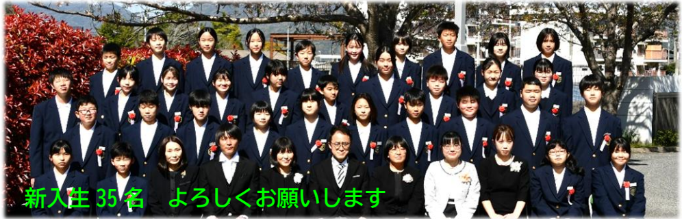
新入生 35名 よろしくお願ひします